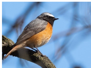
Gekraagde Roodstaart