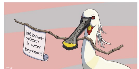
Illustratie: Merycha Franken

Zie voor meer informatie https://www.vogelbescherming.nl/actueel/bericht/natuurorganisaties-slaan-handen-ineen-broedseizoen-aangebroken .