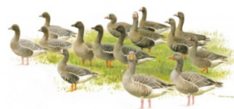
Illustratie: Elwin van der Kolk

Nog een tip: bekijk meteen de activiteiten die de Sovon academie aanbiedt zoals bijvoorbeeld de on-line cursus Water- en wintervogels.