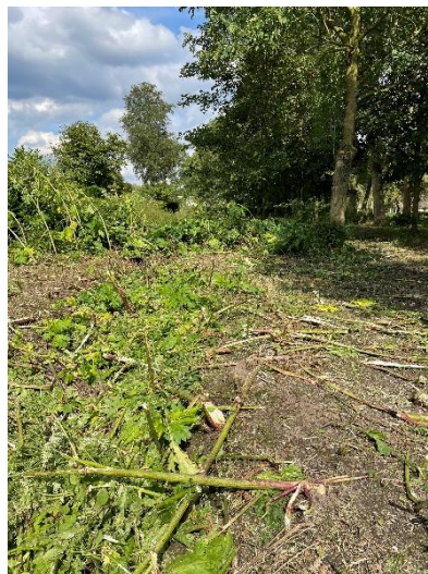
Het vernielde berenklaauwenveld in Oisterwijk

Langs het fietspad in Oisterwijk, ter hoogte van Durendael stond tot 10 juli een behoorlijk veld berenklaauw. Het was een sterrenrestaurant voor heel veel soorten zweefvliegen en solitaire bijen, ik telde ze daar twee keer per week. Tot er bij de gemeente klachten waren ingediend door omwonenden, bij wie deze 'levensgevaarlijke' plant een doorn in het oog was. Nog in volle bloei werd het hele veld met de grond gelijk gemaakt tot een grote, kale zandvlakte. De mens moet wel tevreden gehouden worden. Met een bordje 'Planten niet aanraken; brandwonden!'