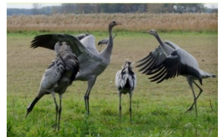
Jonge kraanvogels

Aanmelden graag via lezingen@westbrabantsevwg.nl