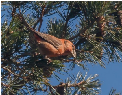
Grote Kruisbek