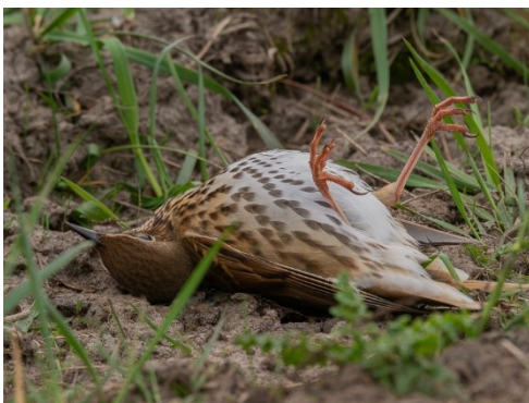
Dode Zanglijster

In augustus 2024 zijn via de invoerportalen van het Dutch Wildlife Health Centre (DWHC) en Sovon ongeveer 250 zieke of dode Merels gemeld. Dat waren er beduidend meer dan in de voorgaande maanden. De meldingen waren afkomstig uit een groot deel van het land, al ging het in Noord-Holland, Zuid-Holland, Zeeland en de Waddeneilanden slechts om een zeer klein aantal. Uit de vogeltellingen van het LiveAtlas-project komt eveneens naar voren dat er momenteel minder levende Merels worden waargenomen dan normaal.