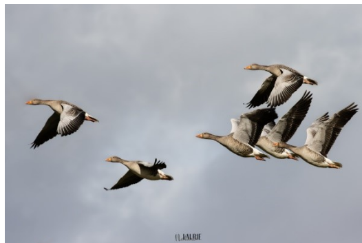
Grauwe ganzen, foto Laurie Rijdsijk

Er is nog plaats bij deze leuke, verrassende trip.