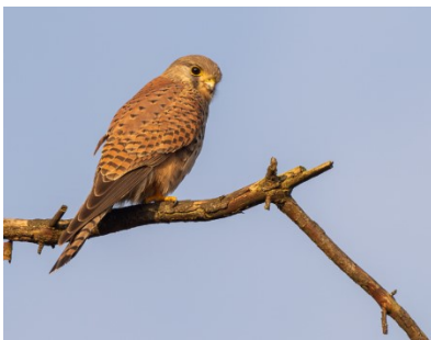
Torenvalk, foto Ria Lambregts

In opdracht van Vogelbescherming is ter voorbereiding van het Jaar van de Torenvalk een voorstudie uitgevoerd. Doel van deze voorstudie is om de huidige kennis met betrekking tot het voorkomen, populatieontwikkeling, broedsucces en overleving van de Torenvalk op een rij te zetten en daaruit voortvloeiend de belangrijkste kennislücken te identificeren.