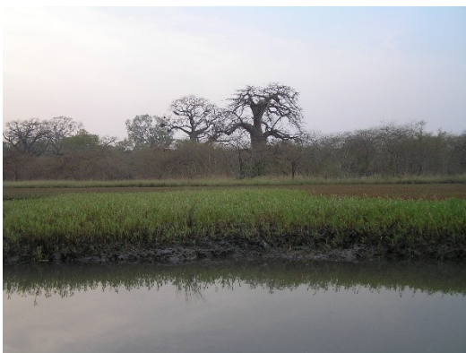
Baobap, foto Wilma Rasink

Op donderdag 06 februari zal Gert van der Hart bij ons te gast zijn om dieper in te gaan op de relatie tussen mens en natuur.