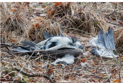
Dode Blauwe Reiger

De huidige uitbraak van het hoogpathogene H5N1-virus, dat sinds november voor verhoogde vogelsterfte in Nederland zorgt, grijpt flink om zich heen. Met name Brandganzen in Noord-Nederland worden hard getroffen, maar ook bij andere soorten en in andere gebieden is het virus vastgesteld. Waakzaamheid is dus geboden.