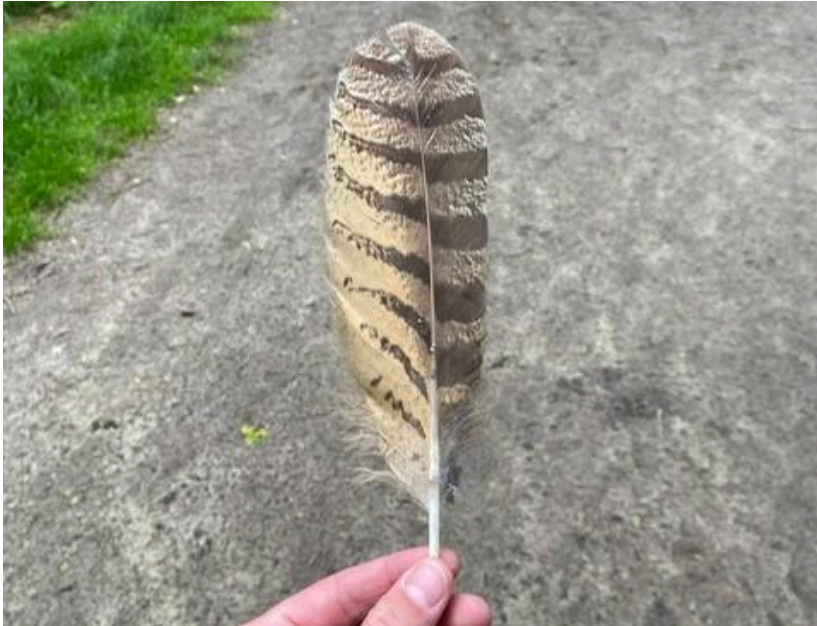
Figuur 6: Veer van de Oehoe

In mei werd bovendien een langverwachte nieuwe soort gevonden: de Oehoe ( Bubo bubo ). Tot in juni werd de vogel nog enkele keren waargenomen. Op 2 juni werd ook een veer van de vogel gevonden. Het ging waarschijnlijk om een solitaire vogel.