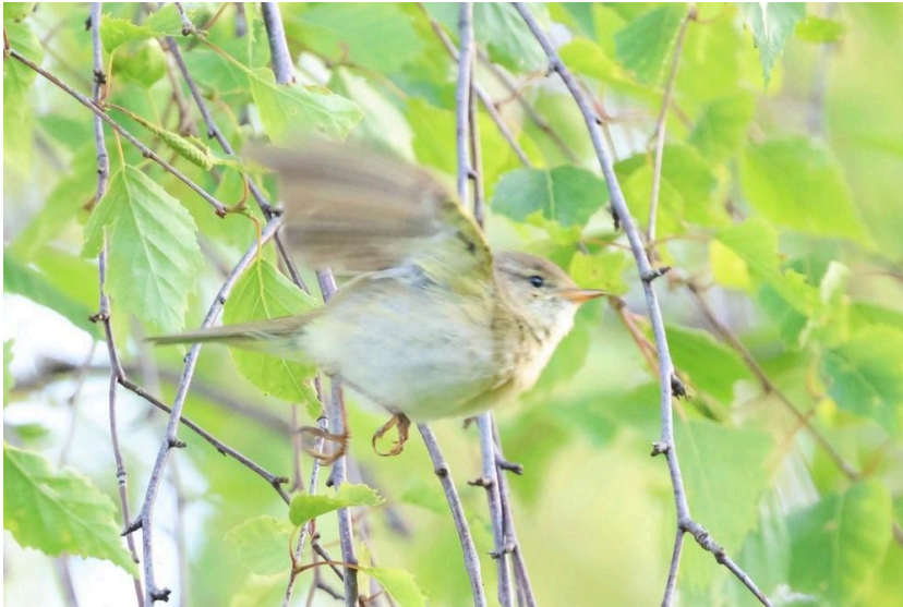
Figuur 3: Iberische Tjiftjaf ontdekt door Bianca van den Berg

Op 25 april was er een Engelse Kwikstaart ( Motacilla flavissima ) ter plaatse op Hooijdonk, een lastige soort in Breda met vaak maar enkele waarnemingen per jaar. Op dezelfde dag vloog er een Rosse Grutto ( Limosa lapponica ) >n over Hooijdonk. Op nagenoeg hetzelfde plasje als waar de Engelse gele zat was op 30 april ook een Noordse Kwikstaart ( Motacilla thunbergi ) ter plaatse. Op 29 april vloog er een tweede kman Steppekiekendief ( Circus macrourus ) over de Lage Vuchtpolder, de vogel kon gefotografeerd worden. De Zomertortel ( Streptopelia turtur ) was ook dit jaar nog present op de bekende plek bij het Doornbos, hopelijk is het niet het laatste jaar dat we de soort in de gemeente kunnen vaststellen.