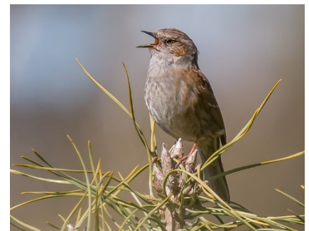
Heggenmus, foto Ria Lambregts

https://sovon.nl/tellen/telprojecten/meetnet-urbane-soorten-mus