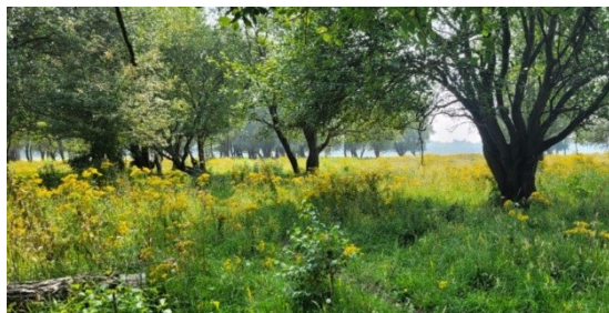
Dintelse Gorzen, foto Jan Benoist

Zaterdag 22 maart neemt de werkgroep Dintelse Gorzen ons mee door hun werkgebied. Leer meer over het gebied en ontdek de grote diversiteit aan vogels. Het is een buitendijks natuurgebied waar na de afsluiting van het Krammer Volkerak bossen zijn ontstaan in het open slikken en schorregebied. We gaan in kleine groepjes op pad om het gebied goed te kunnen ervaren. Mogelijke waarnemingen zijn o.a. eenden- en ganzensoorten, reigers, roofvogels,